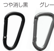
カラビナ (小) 60mm