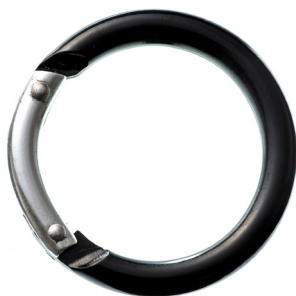
丸型アルミカラビナ (小)