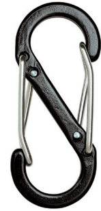
S型 Wフックカラビナ

【サイズ】 W22mm×H51mm 【材質】 本体：アルミ合金 パネ：ステンレス