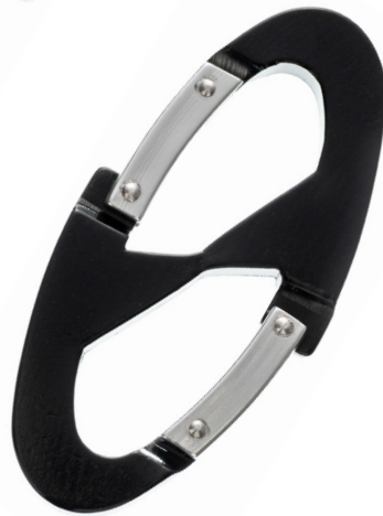
W フックアルミカラビナ (小)