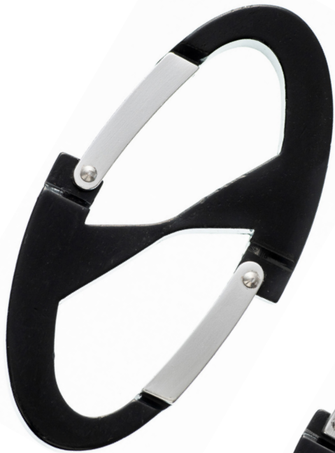
W フックアルミカラビナ (大)