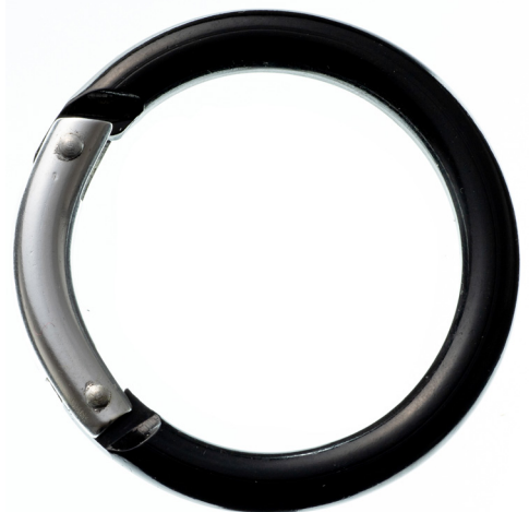
丸型アルミカラビナ (大)