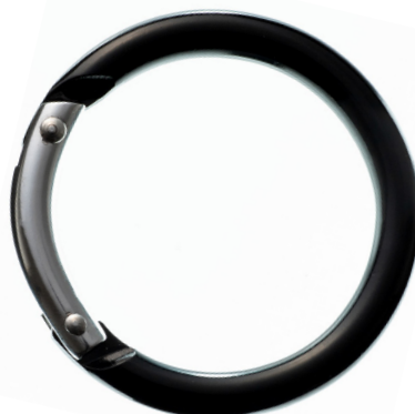
丸型アルミカラビナ (中)