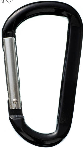
カラビナ (大) 80mm