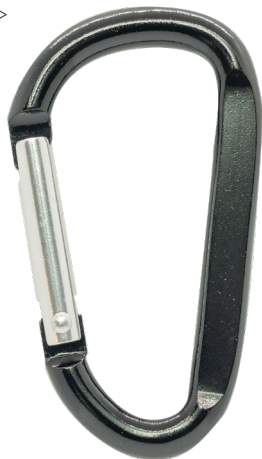
カラビナ (F) 60mm